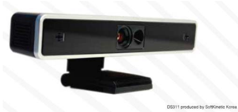
DS311 produced by SoftKinetic Korea